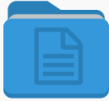
Ön Kayıt İşlemleri